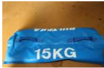
おもり (15 kg×10 個)