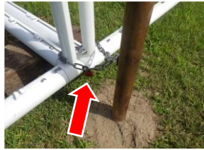
チェーンで固定し南京錠