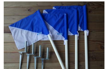
コーナーフラッグ 4 本 (専用杭)

※利用者が多い期間中のネットはつけたままにしていますが、時期と場合によって取り付けと取り外しをお願いする場合がございますので、管理人の指示に従ってください。